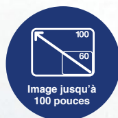
Image jusqu'à 100 pouces